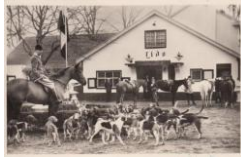
Nazi resort "Lido" Mierlo

Many distinguished guests from the Third Reich visited the luxurious restaurant Lido located on the geldropseweg near the galgenven in the middle of the nature of forests and heathland. Philips and van Doorne transformed Lido into a place to conclude many lucrative trade agreements with the Nazis.